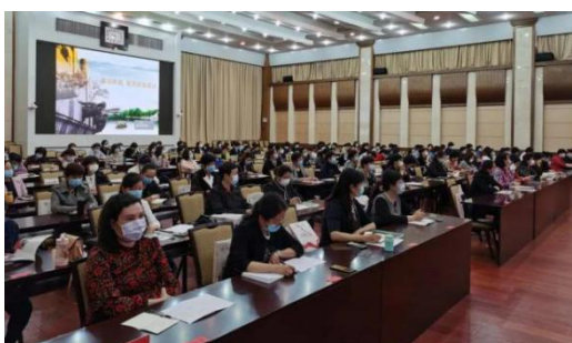
信息来源：兰州市妇联