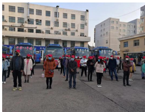
信息来源：平凉市妇联